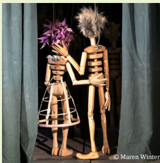
Schloss Reinbek ReinbekerFigurenTage