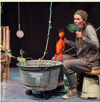
Schloss Reinbek ReinbekerFigurenTage