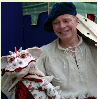
Schloss Reinbek ReinbekerFigurenTage